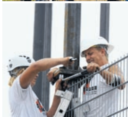
Soll ins berühmte Guinnessbuch der Rekorde: das spektakuläre Werk der Neftenbacher Zaunbauer.